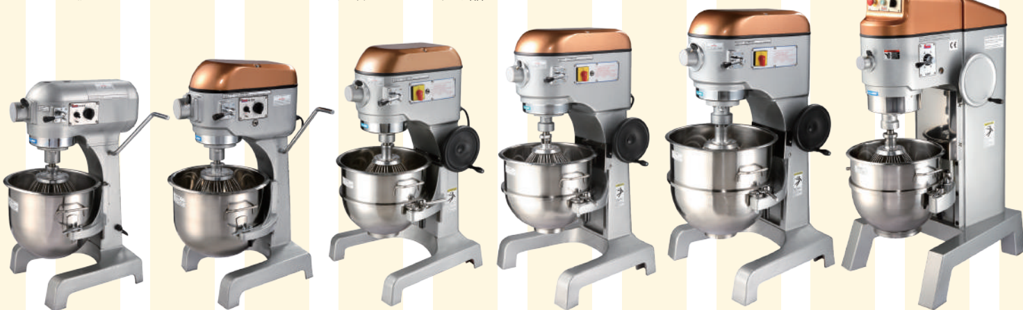
SP-5MX/SP-7MX SP-25MA SP-30MA/SP-34MA SP-40MA/SP-50MA SP-60MA SP-B60H/SP-B80H