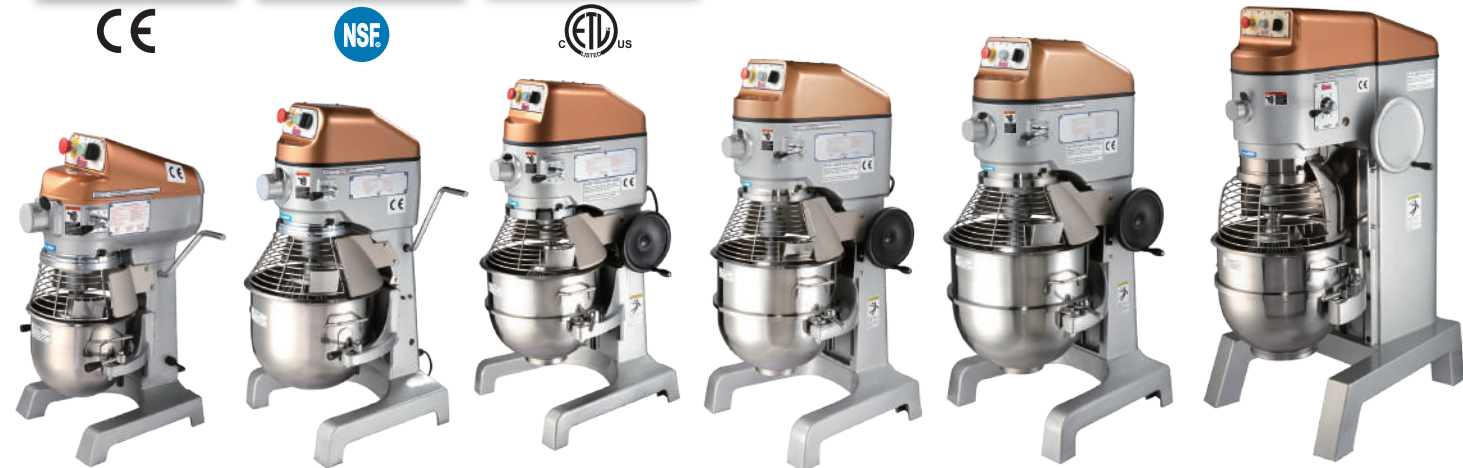
SP-100A/SP-200A SP-22HA SP-30HA/SP-34HA SP-40HA/SP-50HA SP-60HA SP-B62P/SP-B80HI